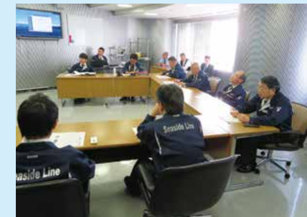
軌道事故復旧訓練の実施状況

9月9日、架線剥離が発生したことを想定して対策本部を立上げ、「軌道事故・災害対策規程」および「異常時対応の基本行動マニュアル」に基づき、対策本部長(社長)を中心とした軌道事故復旧訓練を実施しました。