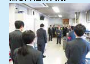
運輸部長の巡視状況 (駅務区)