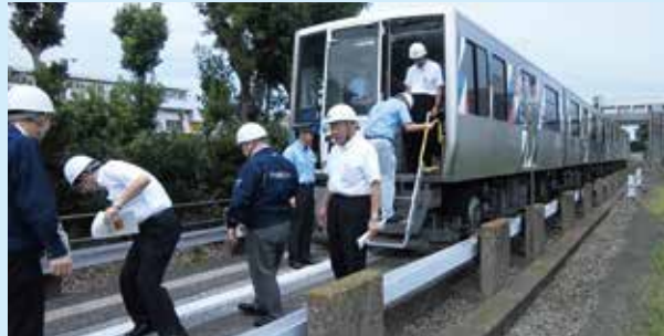
避難誘導訓練の実施状況

9月1日(防災の日)、大規模な地震が発生したことを想定し、情報伝達訓練および運行している列車の駅一旦停止訓練を実施するとともに、車両基地にて車両非常口扉からの避難誘導訓練も実施しました。