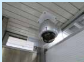
ホーム防犯カメラ