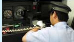
指導指令式施行の 通告を受けた運転員