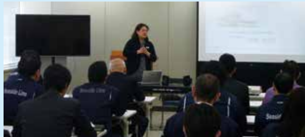
社員全体研修の実施状況

2月19日・20日・21日、全社員を対象に「異常時コミュニケーション」をテーマとして、外部専門機関(鉄道総合技術研究所)から講師を招き、職場間の情報伝達やコミュニケーションの重要性などについて、研修を実施しました。