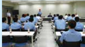
訓練実施に対する 直前ミーティング