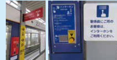
駅ホームの非常停止ボタンおよび インターホン