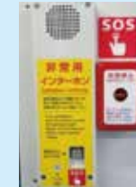
電車内の非常停止 ボタンおよび インターホン