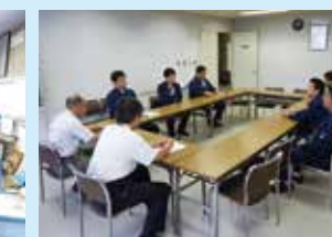
技術部長の巡視状況 (検修区との意見交換会)