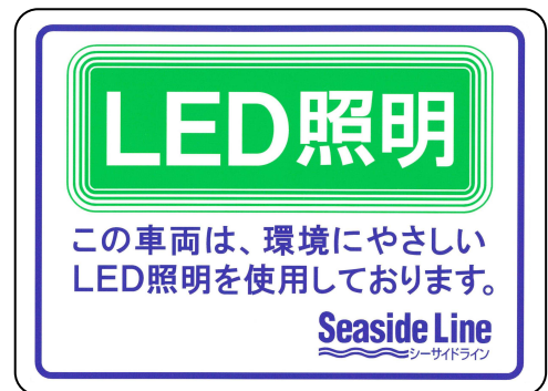
LED照明車両ステッカー

なお、今回導入するLED照明を採用した車両には、ドア付近にステッカーを貼り付けます。