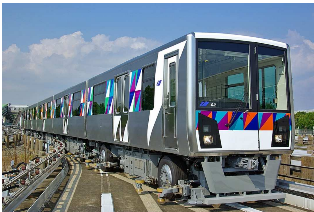
LED照明を導入する2000型車両