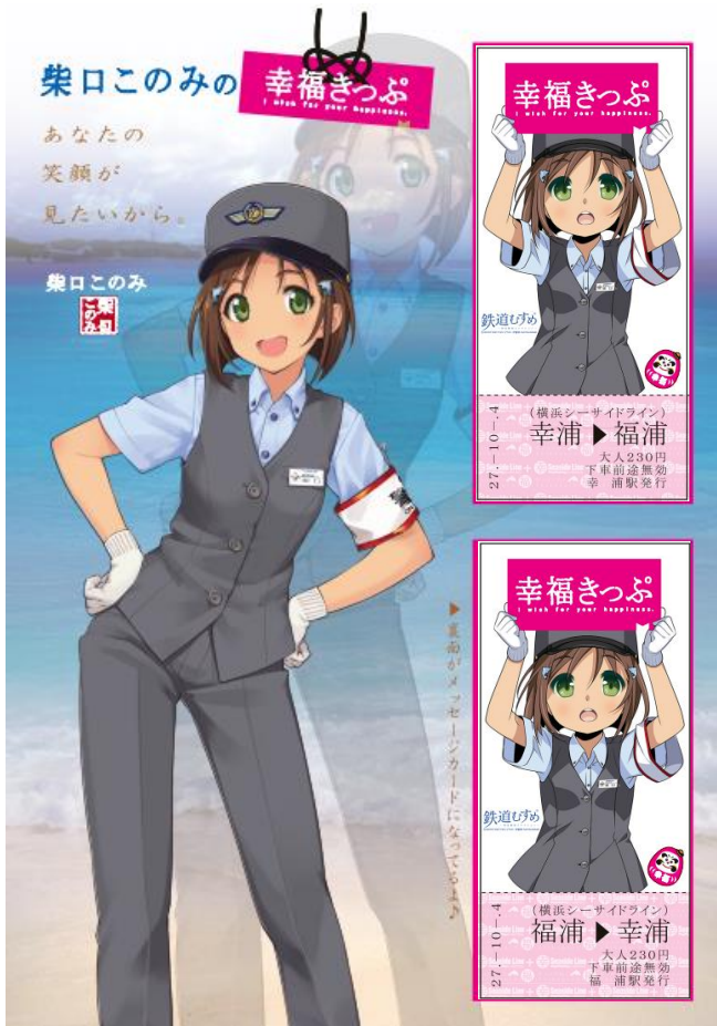
台紙中面ときっぷ