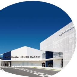
ランチ 横浜南部市場