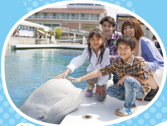
横浜・八景島 シーパラダイス