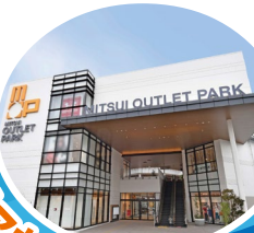
川井アウトレットパーク 横浜ベイサイド