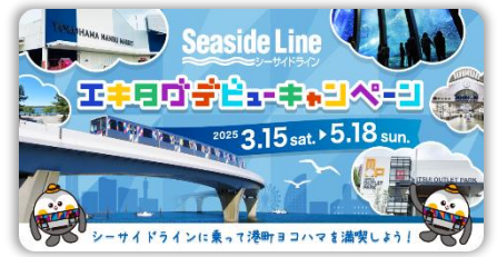
キャンペーンバナー