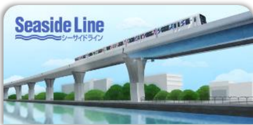
シーサイドラインスタンプ帳ラベル